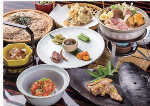
北信濃山里御膳 <秋～冬の御膳>

※お蕎麦は、季節の炊き込みごはんに替えられます。 ※お料理内容は季節によって替わります。