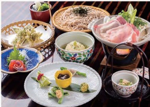
北信濃山里御膳 <春～夏の御膳>

3,600円 (6品)、4,700円 (7品)、5,800円 (8品) (各税込)