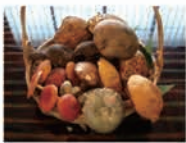
夏のきのこ盛り合わせ

店主が採ってくる 山菜、きのこをはじめとして 地元の食材に 徹底してこだわります。