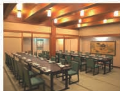
45名様までの和室 (椅子席対応)